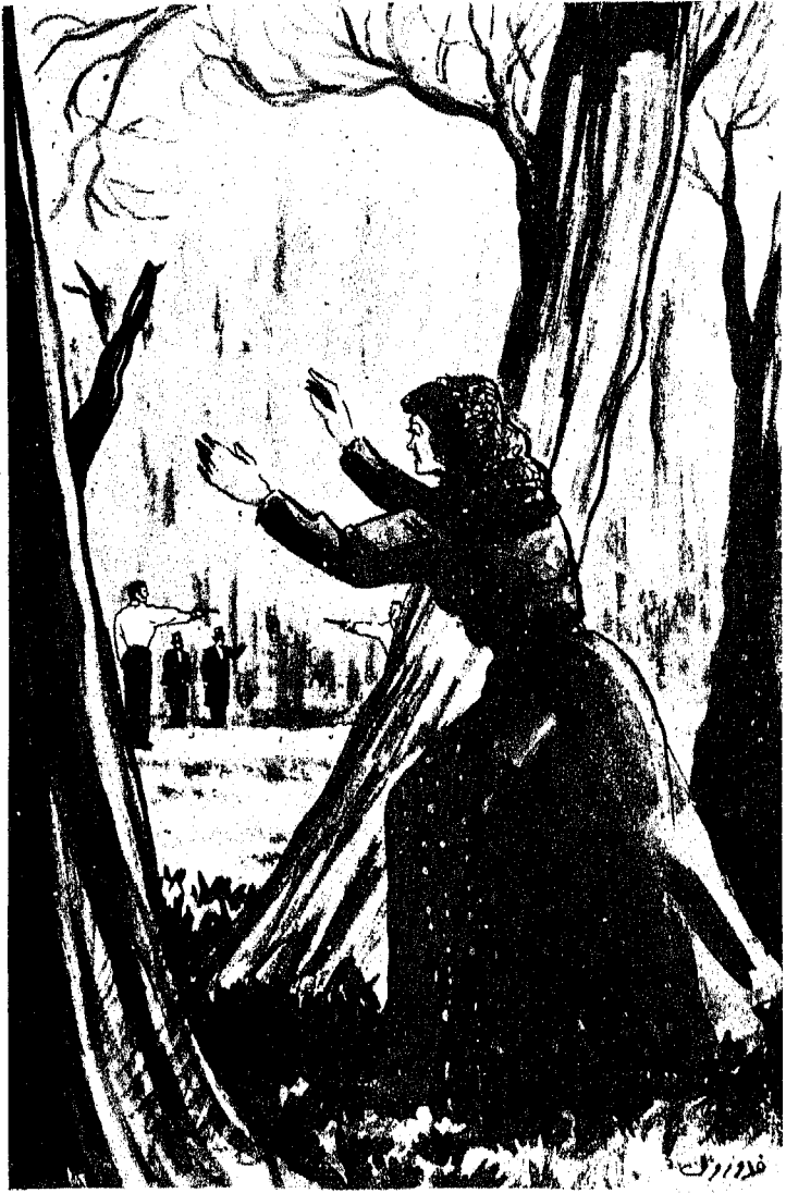
« ووقف الاثنان تفصل بينهما ثلاث خطوات »