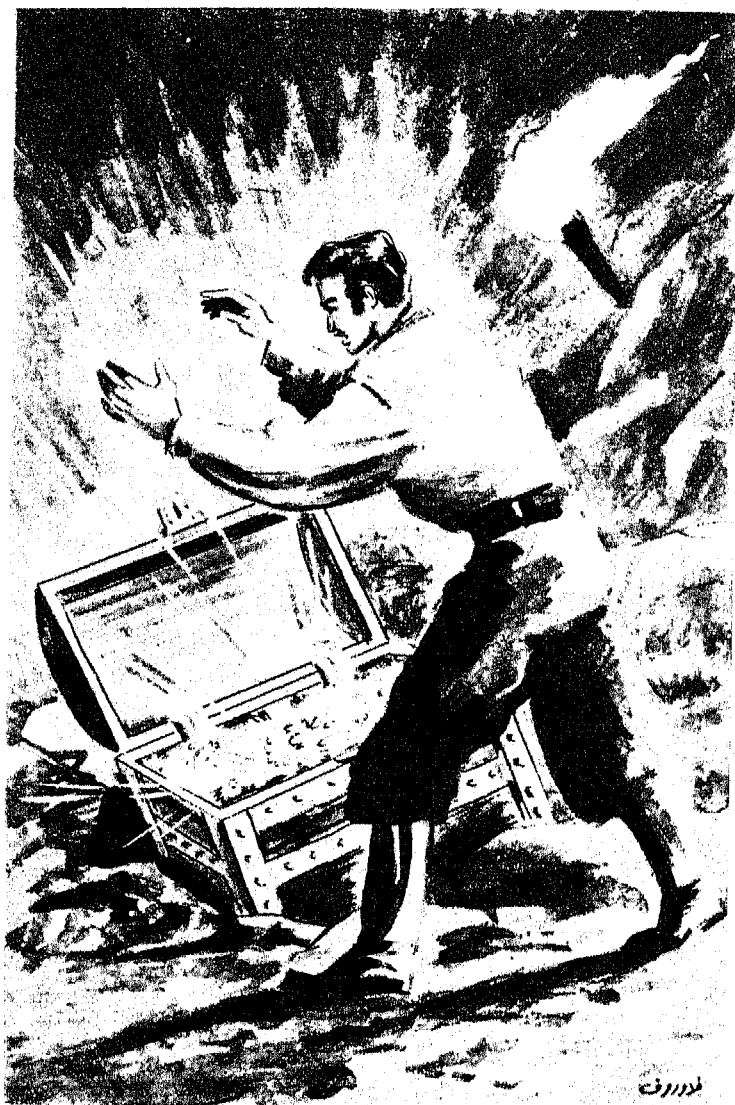
« وحين استرد دانتيس هدوءه ، عكف على احصاء محتويات كنزته »