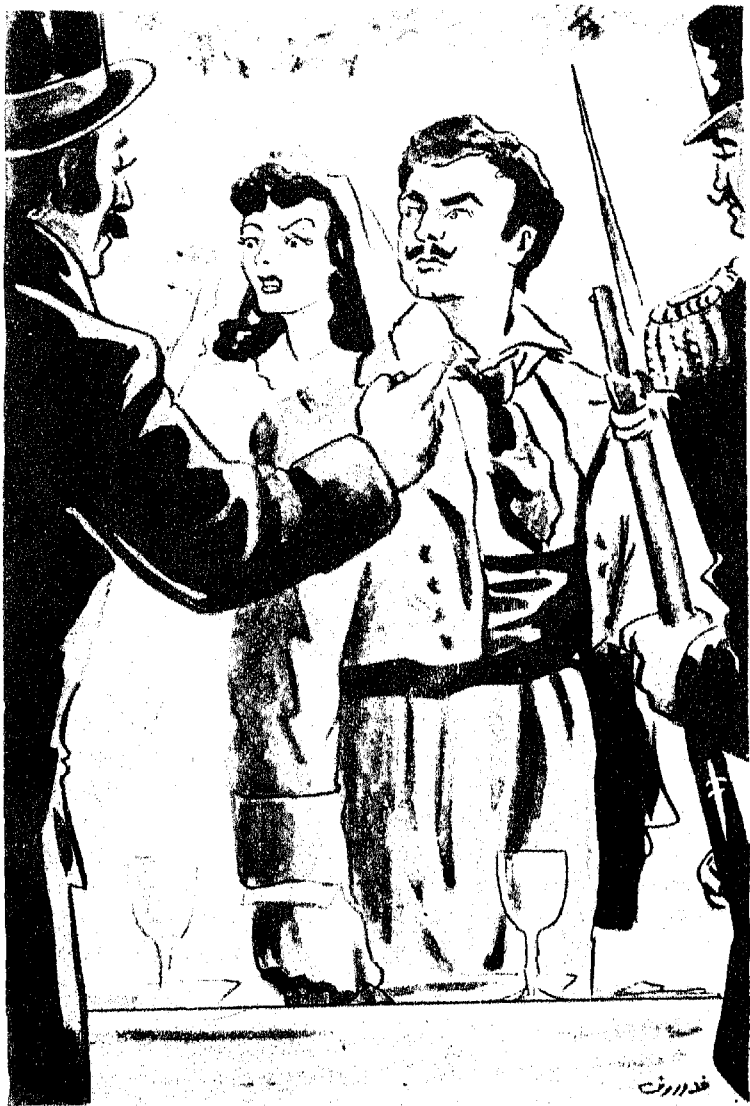
وساح وكيل النيابة : « ادمون دانتيس .. انى اقبض عليك باسم القانون »